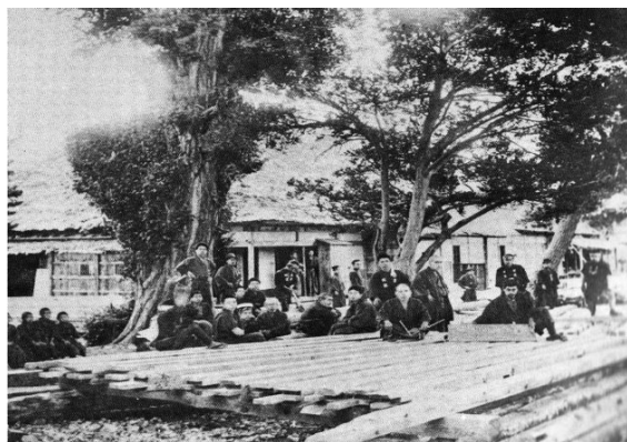
第一番学校・旧松嶺藩陣屋